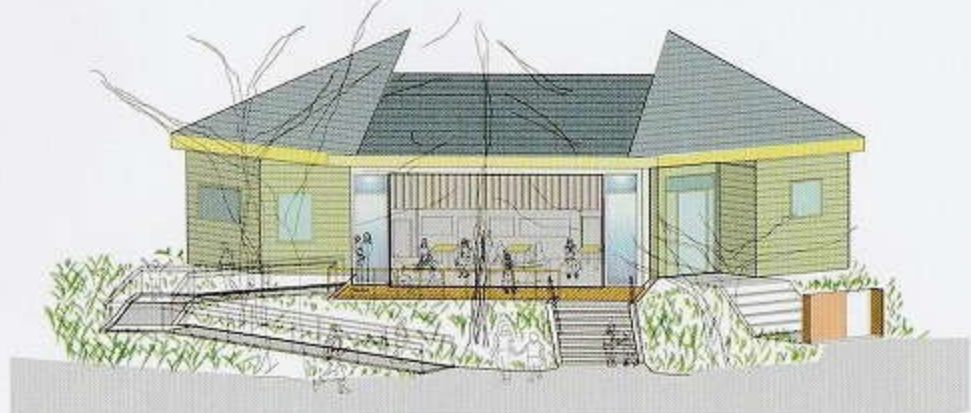
洗足池公園休憩場（整備イメージ）

洗足池水環境改善基礎調査（生物調査） 洗足池の多様な水辺環境と生態系を守っていくための調査を実施します。29年度は水の流入・流出量の調査を行いました。30年度は、池及び池周辺の生物調査（魚類・底生動物・両生爬虫類、昆虫類、鳥類など）を実施し、今後の具体的な水環境改善の事業化を見据えた調査・検討に引き続き取り組みます。 洗足池公園休憩所整備工事 洗足池公園内にある旧管理事務所棟の一部を改修し、公園利用者などが自由に利用できる無料休憩所として開放します。休憩所の前面には洗足池を望む開放的なテラスを設置する予定です。 木々に囲まれた落ち着いた場所にたたずむ休憩所に、ユニバーサルデザインに配慮した新たなスロープを整備するなど、誰もが利用しやすい休憩所を目指して整備します。