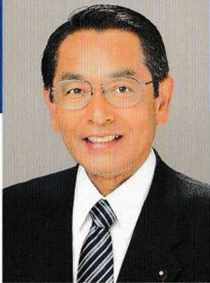
自由民主党大田区民連合